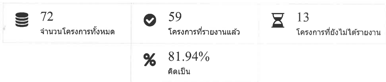
กราฟแสดงภาพรวมโครงการ